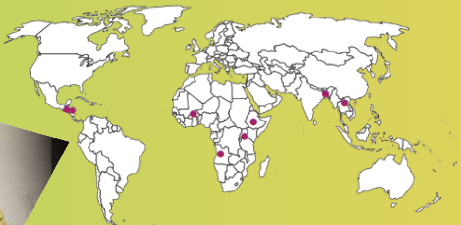
Angola, Burkina Faso, Ethiopie, Rwanda, Bangladesh, Laos, Guatemala et Honduras

Au cours de la première année, le partenariat CDAIS élaborera une vision pour le développement des capacités dans les systèmes d'innovation agricole, basée sur les besoins identifiés par des groupes issus de chacun des huit pays pilotes. Cela constituera la base sur laquelle des interventions personnalisées seront organisées et que le projet CDAIS utilisera pour formuler des décisions politiques et pour soutenir de futurs investissements qui pourront ensuite être généralisés.